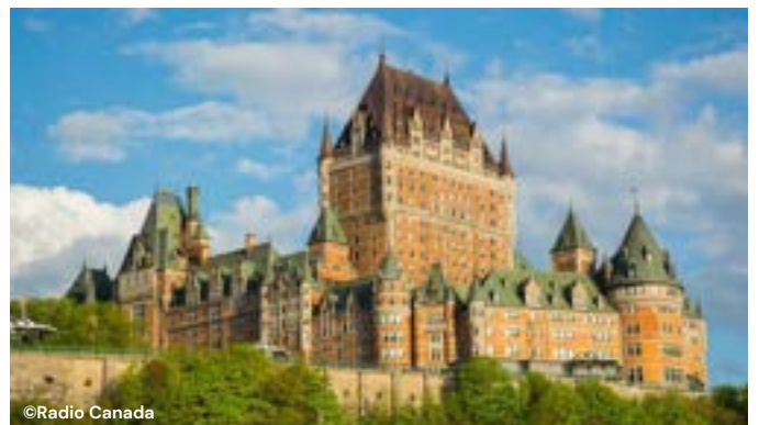
C _ _ _ _ F _ _ _ _ _