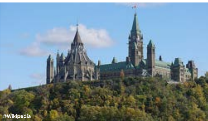
C _ _ _ _ du P _ _ _ _ _