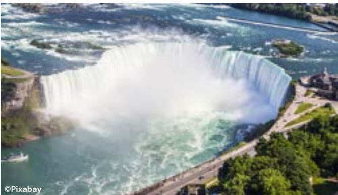
C H U T E S du N I A G A R A