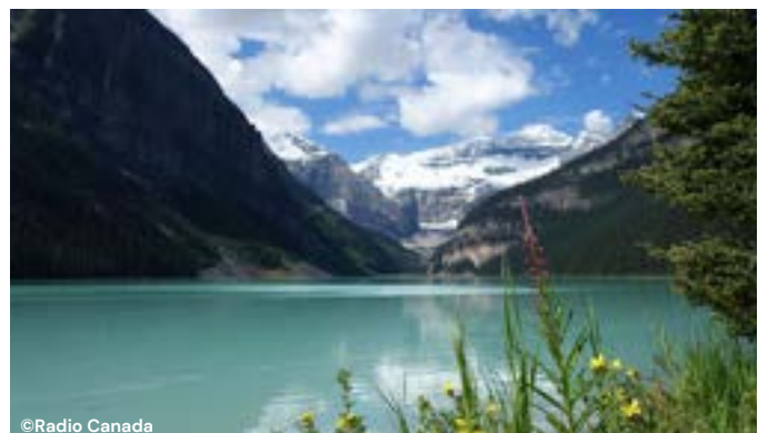
L _ _ L _ _ _ _