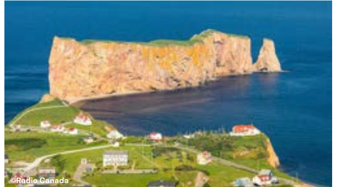
R _ _ _ _ P _ _ _ _