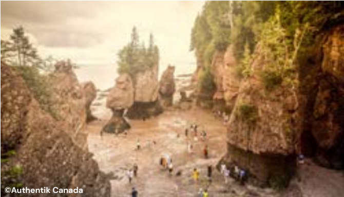
B A I E de F U N D Y

Saurez-vous reconnaître quelques-uns de ces célèbres attraits du Canada? À l'aide des images et des lettres, nommez ces lieux incontournables!